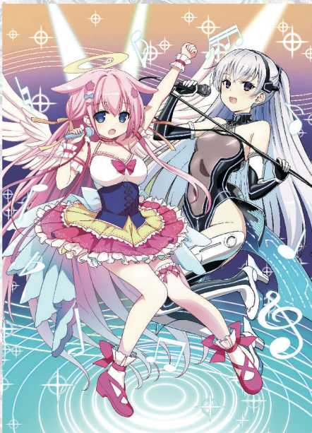
ミーリィ with コー Illust: Bou ＜EXバック サマーステージ!! 収録＞